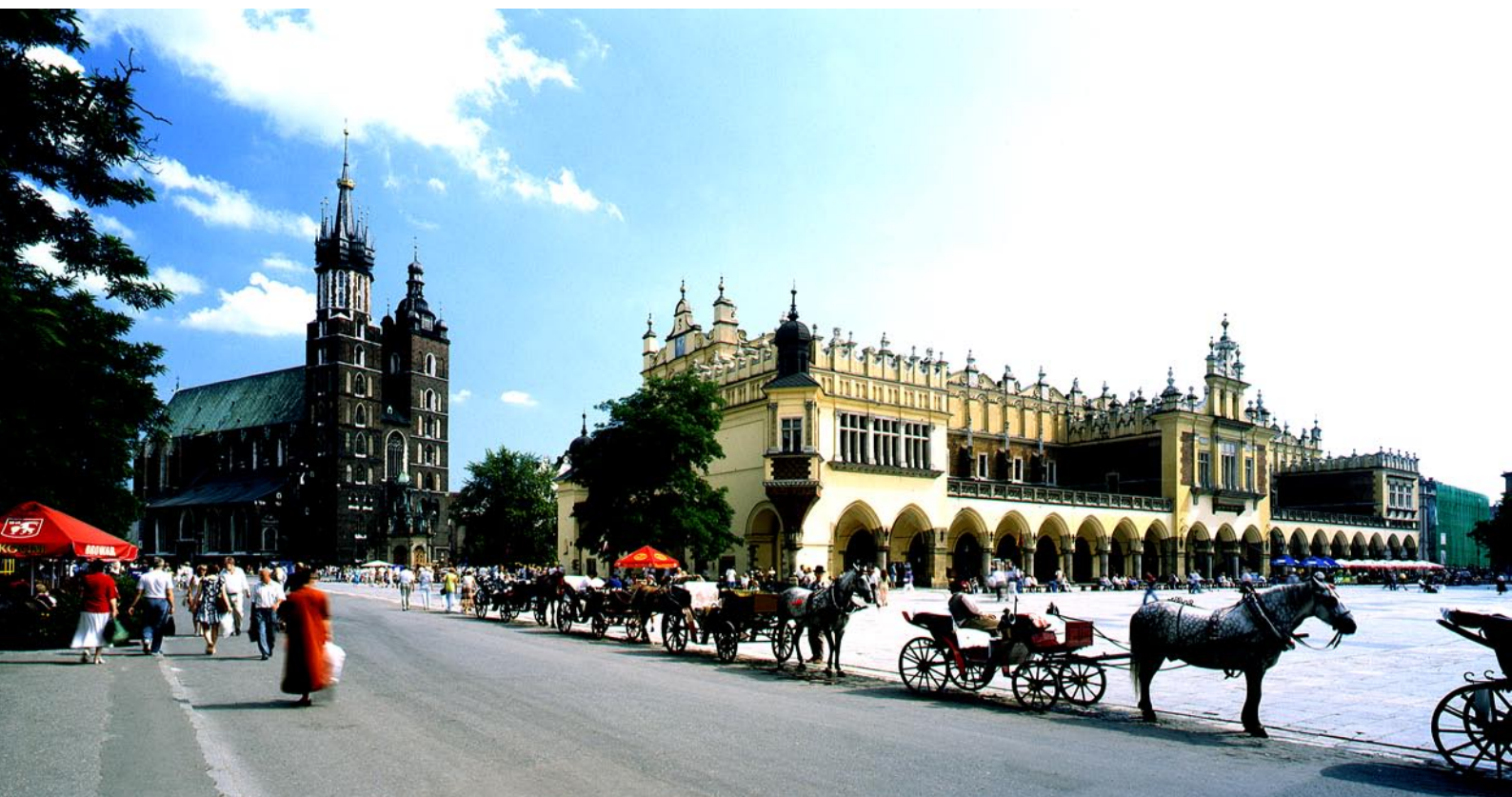
Der Hauptmarkt in Krakau mit der Marienkirche und den Tuchlauben.